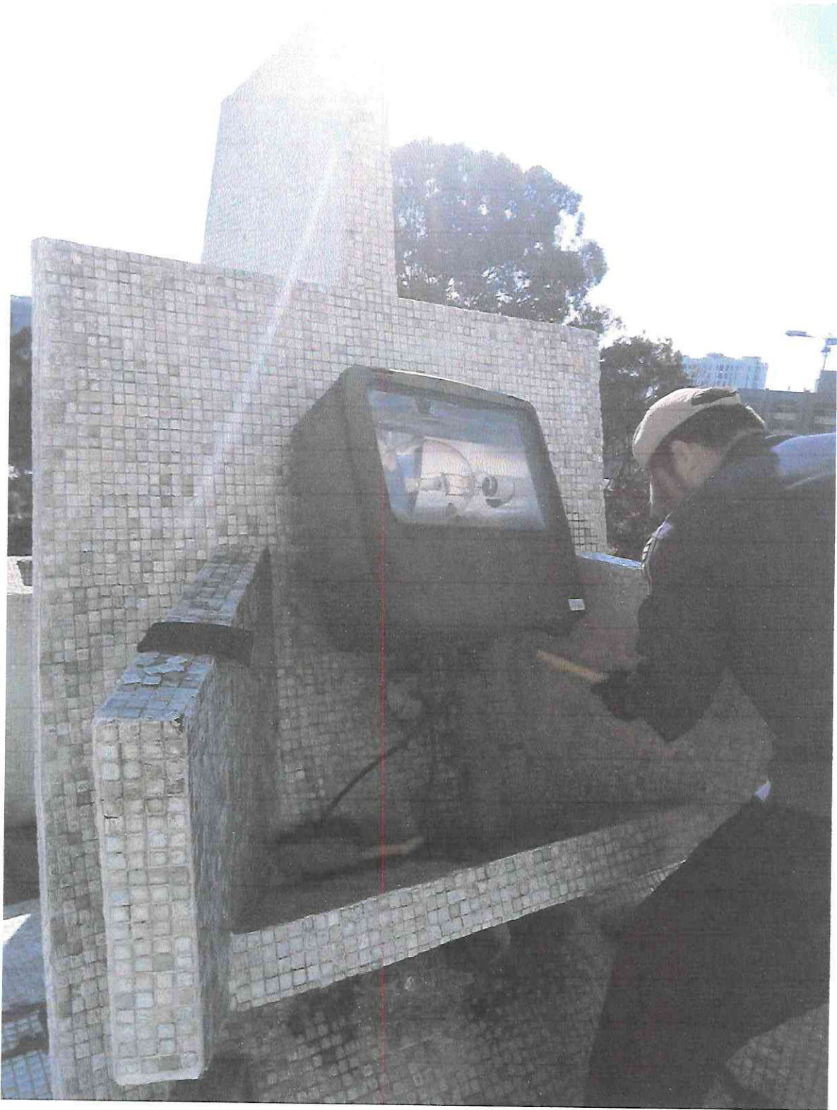
Limpieza de tesela sobre porta luminarias del techo en el sector C1