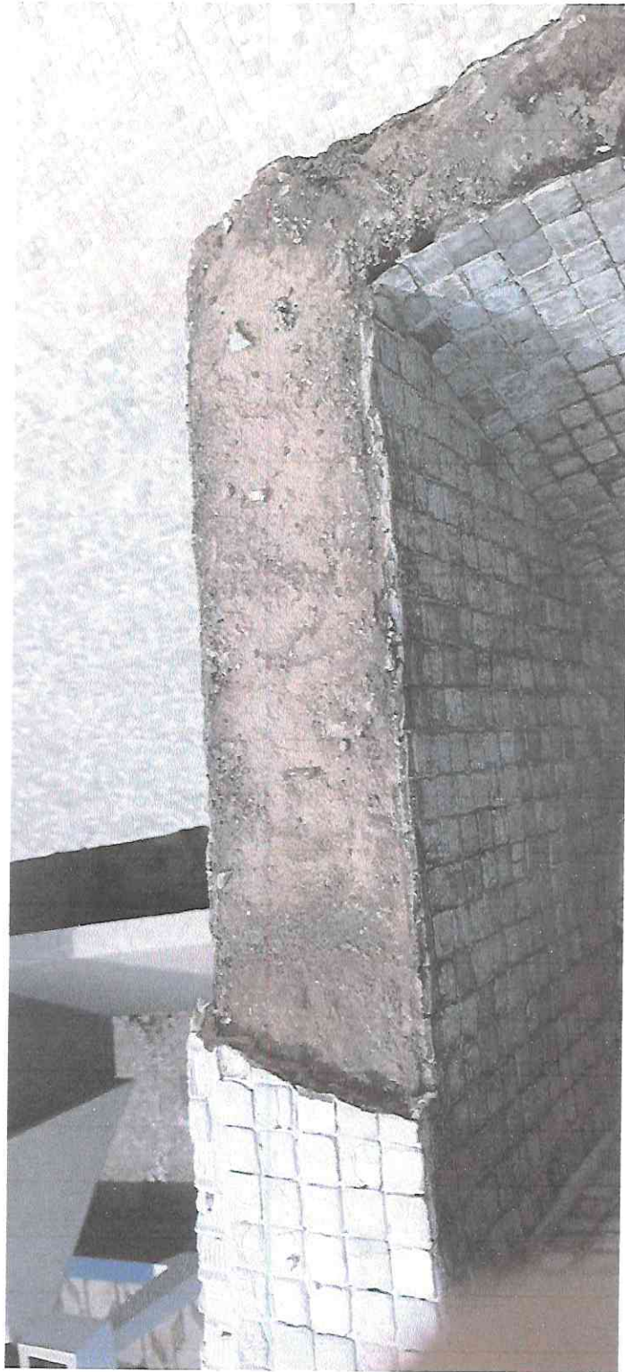
Liberación de agregados sueltos sobre los bordes de las ventanas.